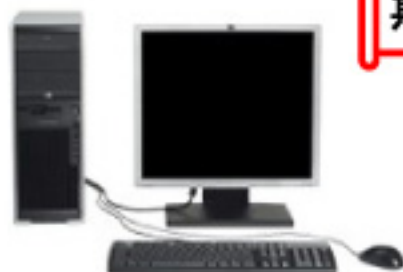
HP XW4600/CT Workstation